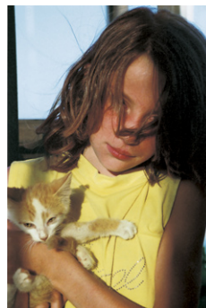
Boy at 12